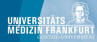
11/2025; Gestaltung: kummerdesign